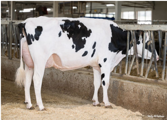
PROGENESIS ROYALFLUSH PRO GRANDDAM