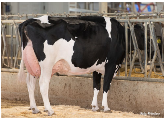
PROGENESIS ZAZZLE PAPRIKA THIRD DAM