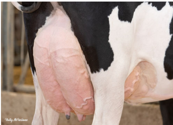
PROGENESIS ZAZZLE PAPRIKA THIRD DAM